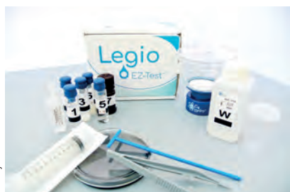
Legio EZ-Test™ de C4hydro est un test simple, utilisable en laboratoire ou sur le terrain, qui rend un résultat positif en cas de concentration en Legionella pneumophila (UFC/L) cultivables dépassant un seuil défini par l'utilisateur.