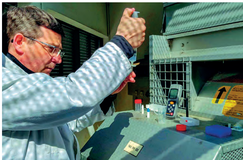
Le kit de mesure par ATPmétrie Dendridiag® de GL Bioncontrol a été adapté pour une mise en œuvre simple et rapide par l'exploitant, le technicien de maintenance ou le traiteur d'eau.