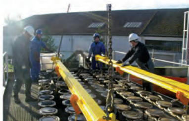
Changement des diffuseurs stations d'épuration de St Omer