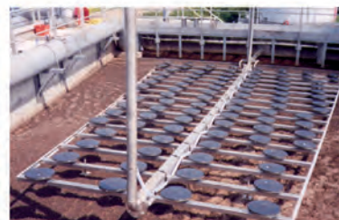
Changement des diffuseurs stations d'épuration de St Omer