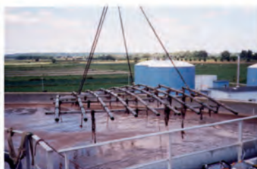
Remplacement complet du réseau Station d'épuration de Meaux