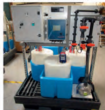
Skid de traitement des eaux de TAR.