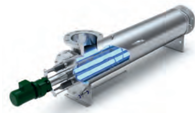
Appareil de traitement UV BIO-UV Group, modèle DWNA, dédié au traitement des légionelles.