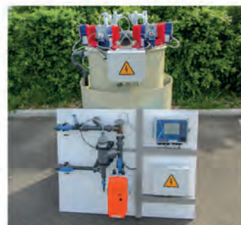
Mesure, régulation et dosage pour eaux industrielles.

Relais alimentés, contacts secs, pulses (0 à 8) Analogiques 4-20 mA (0 à 16)