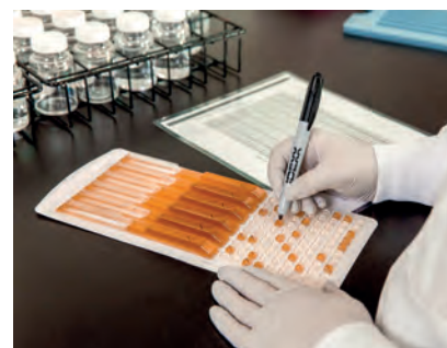
Legiolert® d'Idexx repose sur une technologie de détection d'enzymes bactériennes qui permet, au moyen d'un substrat présent dans le réactif, de mettre en évidence la présence de Legionella pneumophila .