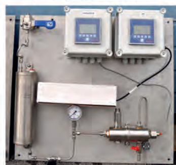
Unité de mesure de pH et de conductivité des eaux de chaudière.